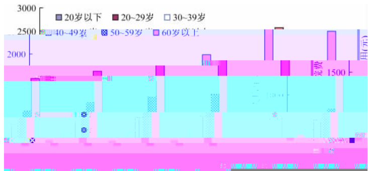
图# 云浮市!" "% 社保年度人均住院费用随年龄变化趋势

以云浮市为例(见图#),该市各年的人均住院费用均与年龄呈明显的正相关关系,且随着时间向前推移,&"岁以上年龄组的人均住院费用有不断升高趋势,年龄组越大,人均住院费用增长越快%在每个社保年度,&"岁以上群体的人均住院费用都远大于更年轻的年龄组%